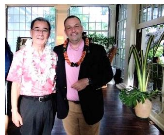
グリーン州知事と