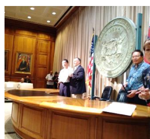
愛媛県・ハワイ州友好姉妹提携