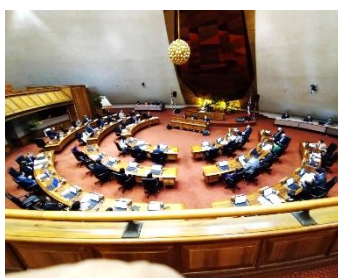
ハワイ・州議会（下院）

その他、これまで20年余の交流を通じて協力いただいていた関係者に、愛媛県知事より功労賞や感謝状などの贈呈も州知事官邸で行われ、これら行事に参加いたしました。