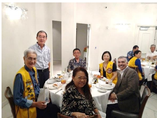
アラモアナライオンズクラブ 会長ご夫妻・幹事ご夫妻と