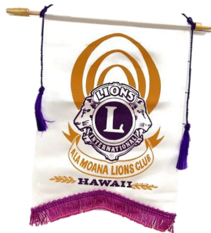
今回の訪問で、クラブバナーの交換と クラブジャンパーの贈呈を行いました