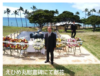
えひめ丸慰霊碑にて献花

2001年2月10日、愛媛県立宇和島水産高校の実習船「えひめ丸」（35名の乗組員）が、ハワイ沖で遠洋航海実習中、急に浮上してきたアメリカ海軍の潜水艦と衝突し沈没、教員・乗組員5名と、学生4名が亡くなるという痛ましい事故が起こりました。