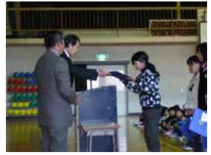
2012年12月12日（水）神拝小学校集会の中で表彰式を行いました。