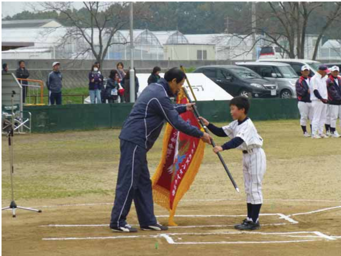
開会式にて前年度優勝チームより優勝旗返還