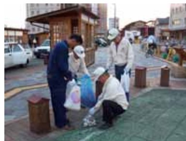
第52代 安藤執行部の描いたクラブの1年間・・・