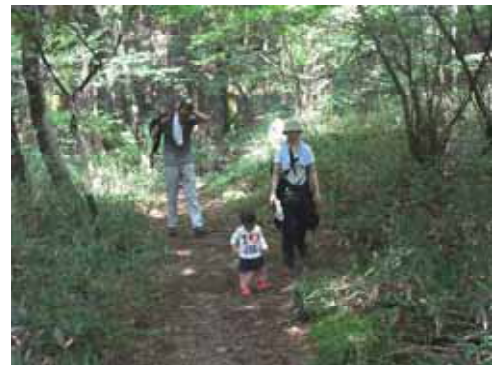
趣味は山とバドミントンです