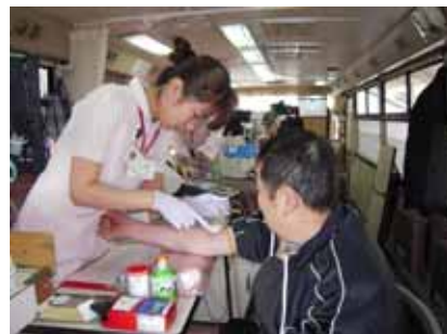
朝早くから献血会場に足を運んでいただきありがとうございました