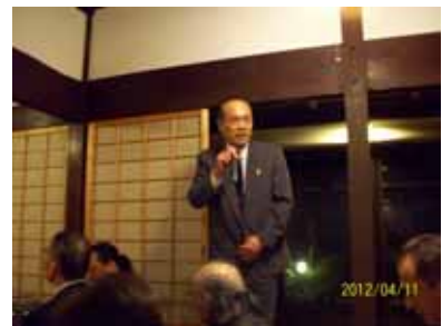
歓喜庵本館で例会を開催。東予LC会長、伊予小松LC会長に御挨拶をいただきました。