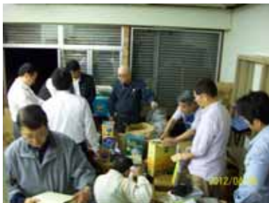
値付け作業も随分と手際よくなりました

しかし、残念ながら値引きにて販売をせざるをえず、無いなかで物品を提供していただいた方には大変心苦しく感じています。ただ結果的には、提供していただいた物品のほとんどすべて完売しました。会員の皆さん、来年のバザーに向けて、提供できる物品をストックしておいて下さい。宜しくお願い致します。