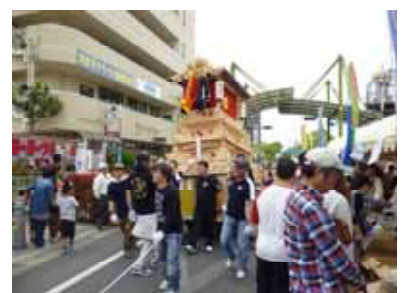
だんじりの登場に会場も大盛り上がり