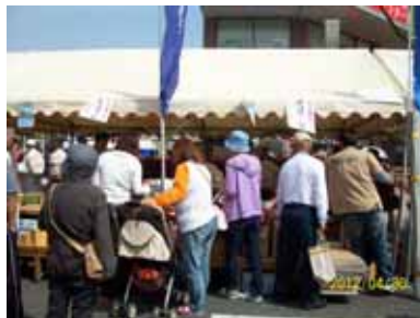
売り手と買い手の間にも「あ・うん」の呼吸が感じられます