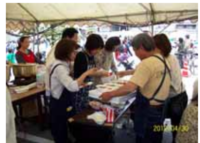
西条LC特製カレーも回を重ねるごとに味いに深みが増してきました。シェフの腕に自信あり！