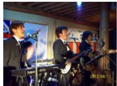
【タイム・トンネル】最高！馴染の曲になると自然と口ずさみ、体でリズムをきざみます。