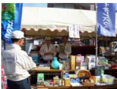
掘り出し物は見つかったでしょうか。毎度ありがとうございます。