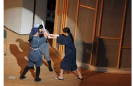
時代劇スペシャルでは、趣向を凝らした寸劇を交えての演奏で場内を盛り上げました