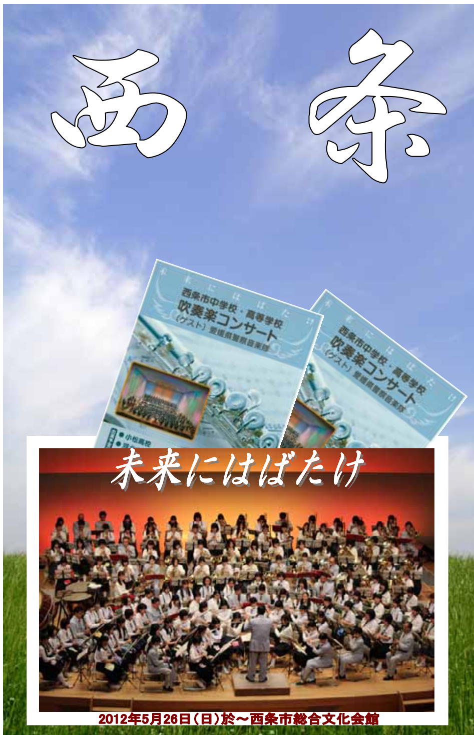
2012年5月26日(日)於～西条市総合文化会館