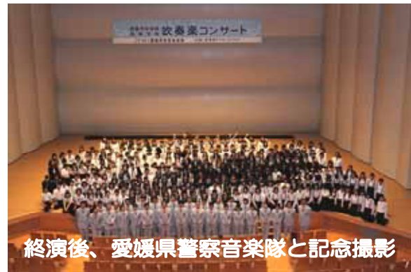
終演後、愛媛県警察音楽隊と記念撮影