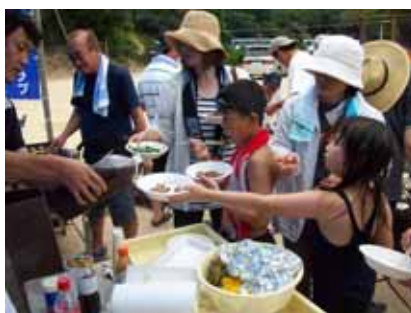
楽しい夏を満喫しました