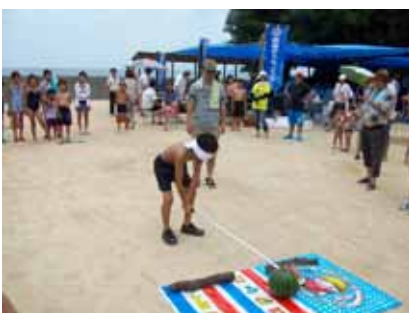
「スイカ割り」 ジャストミート！