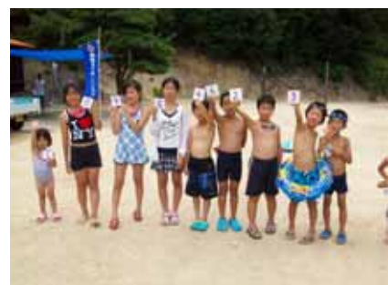
宝探しで見事お宝ゲット！