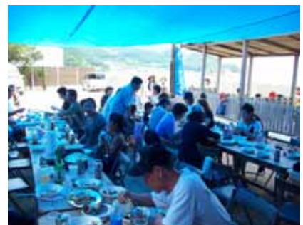
海の幸いっぱいバーベキュー