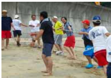
子供達に交じって大人も童心に戻り地引網を引き揚げました