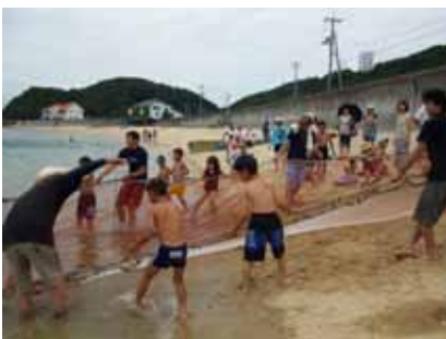
「何が捕れたかな～」みんな興味津々です