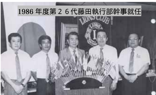
1986年度第26代藤田執行部幹事就任