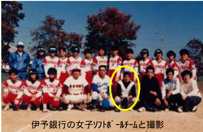
伊予銀行の女子ソフトボールチームと撮影