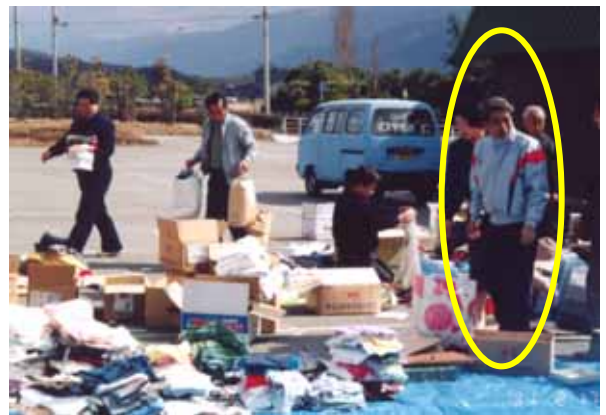
1990年（平成2年）スリランカへ救援物資をコンテナ1台分送りました。