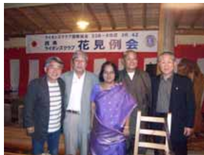
姉妹提携クラブ インドプーバイ LC より リバティさんを迎えて