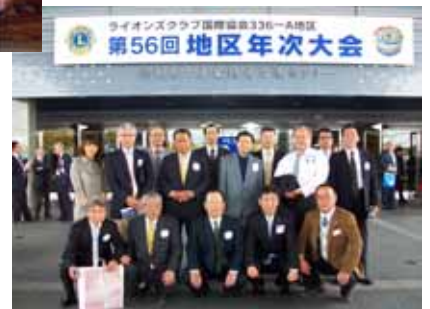
徳島にて地区年次大会 アワード金賞受賞