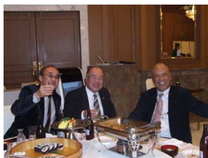
クラブの明るい未来を照らす3人