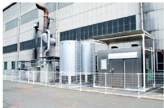
【水素冷凍システム】