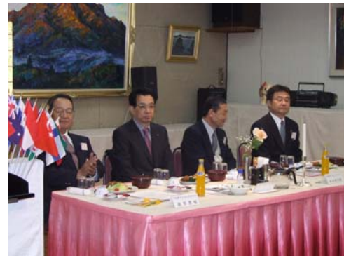
2月第2例会に訪問された今治東LCの皆様