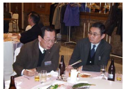
50周年に向けた話し合い中？