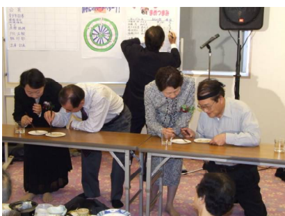
夫婦共同作業「豆つまみ」ゲーム

そして最後になりましたが、念願の『100%出席』が達成できました事、皆様方には心より感謝申し上げます。