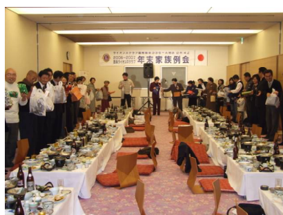
恒例のプレゼント交換！