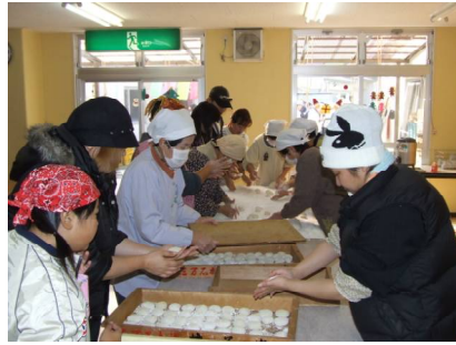
助っ人さん大活躍！