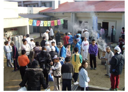
餅米が蒸しあがるまで園生とふれあい