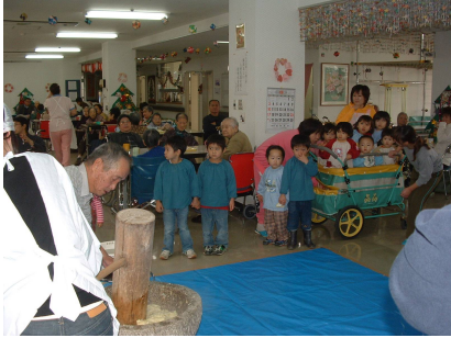
子供達の声援を受けてハッスル！