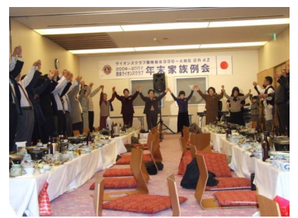
全員で「また会う日まで」