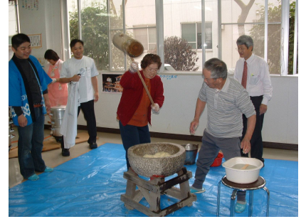
大きな杵を振り上げて餅つきに挑戦