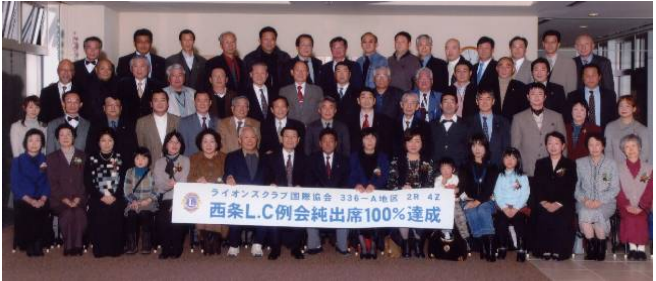
年末家族例会にて今期初の出席100%達成を記念して