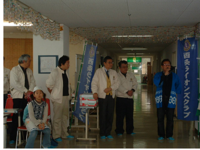
野田第1副会長の挨拶