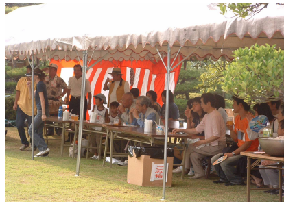
テントの下でビールを一杯