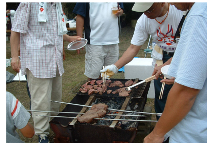
肉の串焼きもプロ級!