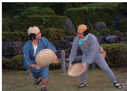
息ピッタリの安来節