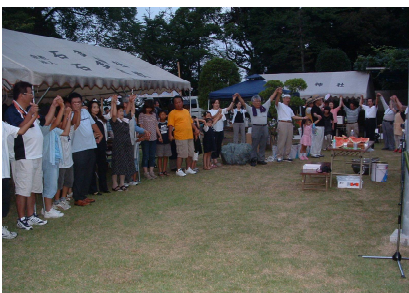
全員でまた会う日まで