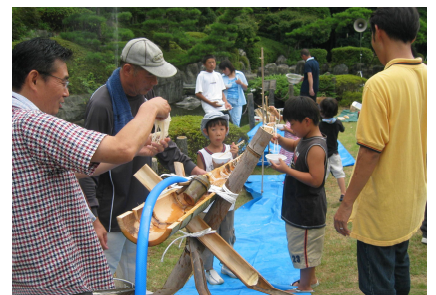
ソーメン流しに毛づつみ