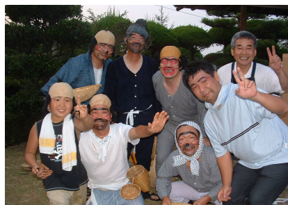
安来節メンバーが勢ぞろい