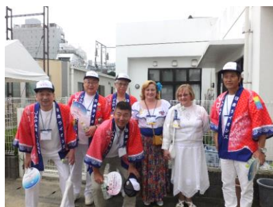
他国ライオンズも民族衣装で