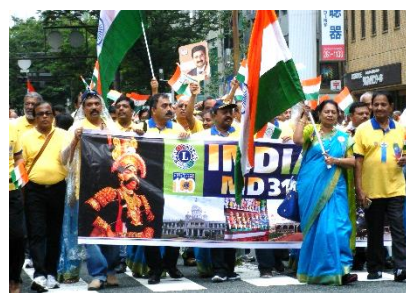
インドライオンズ一行