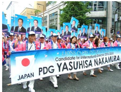
日本ライオンズ一行先頭