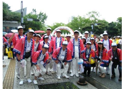
パレード終了ゲート前にて