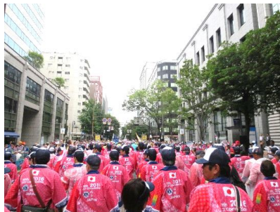
日本ライオンズ一行