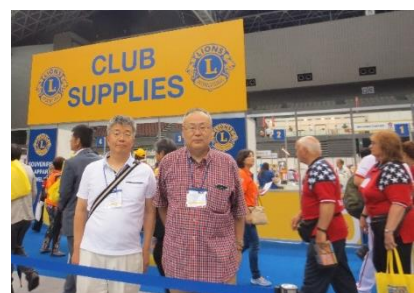
代議員登録もきちんと終えて