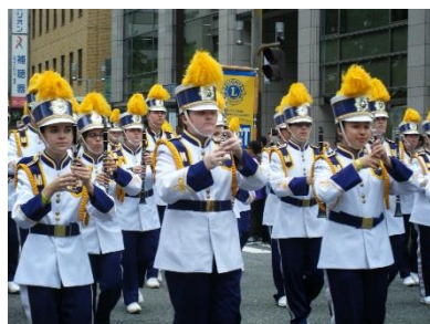
各国パレードの前では楽団演奏もあり