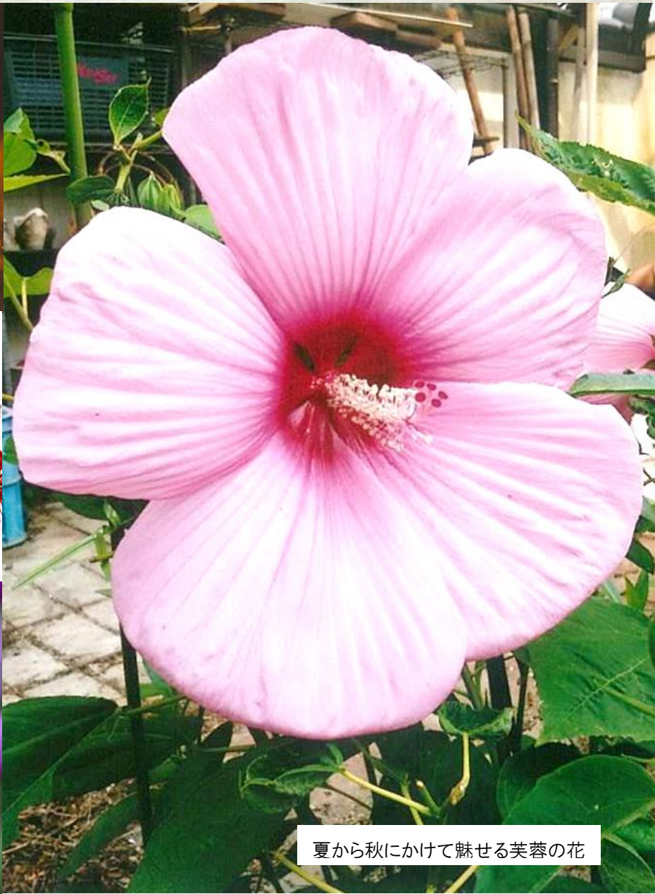
夏から秋にかけて魅せる芙蓉の花