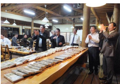
委員会対抗戦の賞品は大量のティッシュ！ なのになぜか顔がほころびますね（笑）