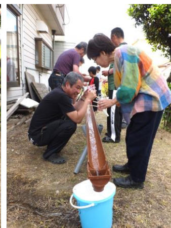
恒例のそうめん流しは大人にも大人気