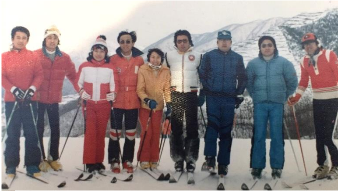
学生時代、白馬八方尾根にスキー行った時の写真です。 あれから40年、今はそり・・・を少々やっています。