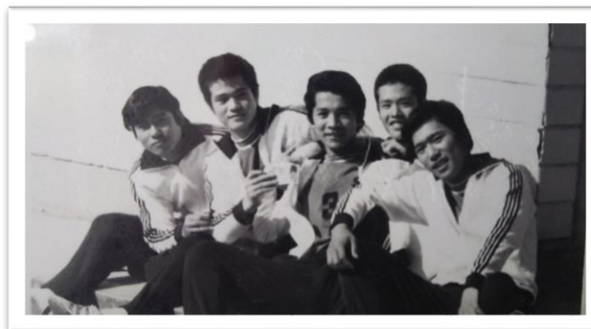
高校時代、勉強もせず、スポーツと悪事した仲間との1枚です