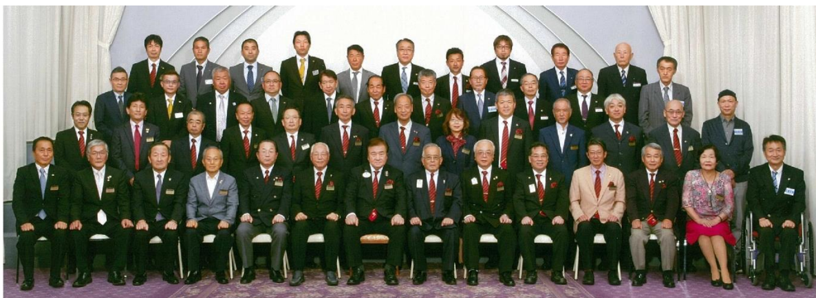
ライオンズクラブ国際協会 336-A地区2R地区ガバナー公式訪問(4Z)記念写真