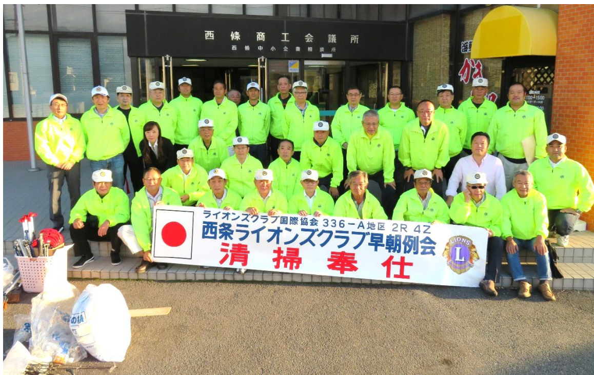
10 月度早朝清掃奉仕終了後、例会場前にて集合写真