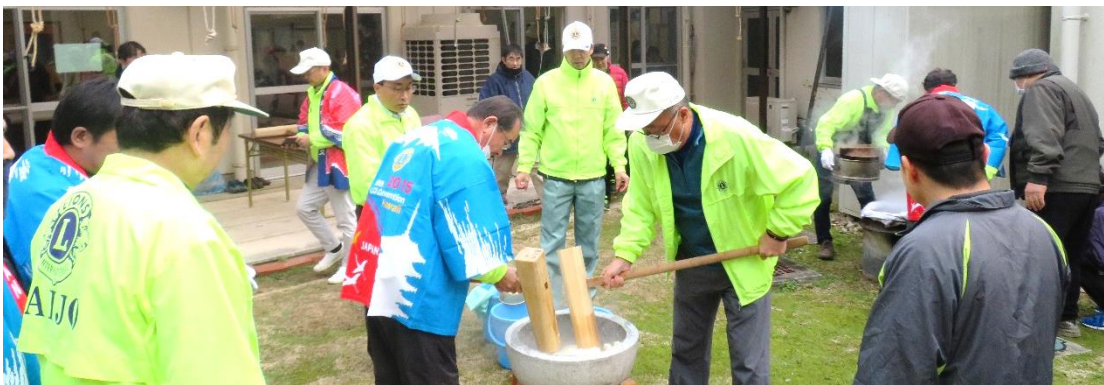
第25回餅つき奉仕 「ゆるぎ荘」・「星の里」に分かれ実施