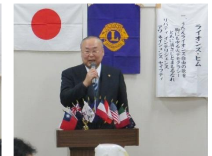
本年、還暦を迎えるメンバー3名による決意表明です