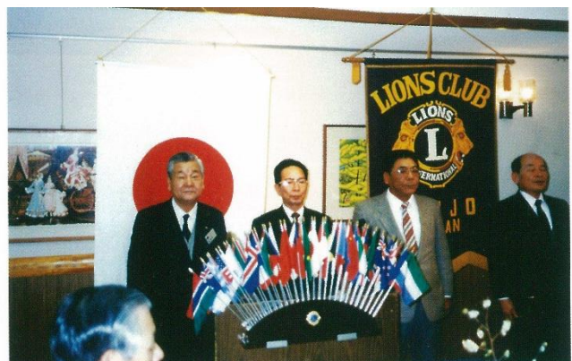
ライオンズ例会で甲子園募金