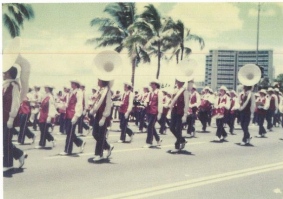
昭和56年6月22日～30日 ライオンズハワイ国際大会