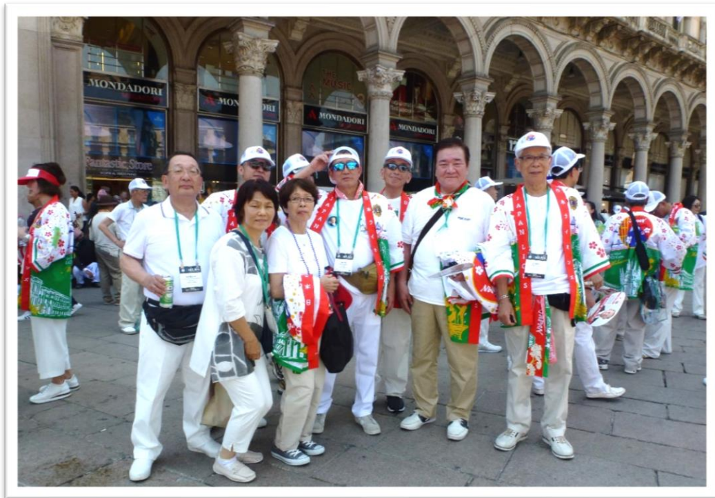
第102回ミラノ国際大会にて