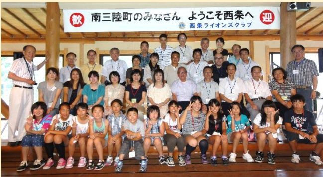
入会に際しましては、資格審査がございますので必ずしも意に沿えない場合がございます