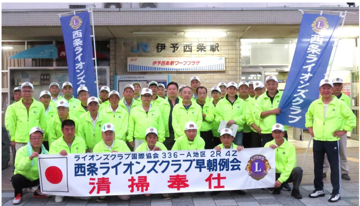
10月1日、西条駅周辺の清掃、施設の拭き掃除を行いました