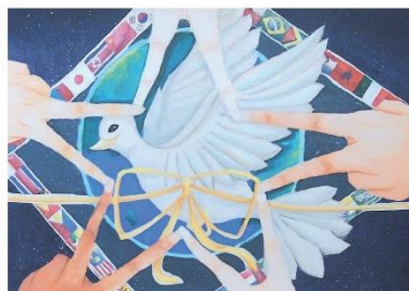
堂野 乃海 徳島県LLC