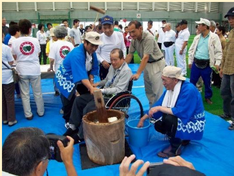
入会に際しましては、資格審査がございますので必ずしも意に沿えない場合がございます