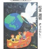
松本 潤那 作中まで...