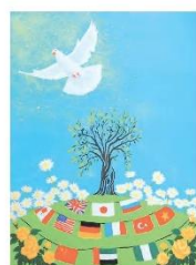
石崎 祥馬 香川県LLC