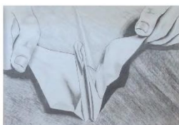
谷水 にこ 高松県立