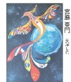
宮藤 聖門 西条市立