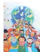
西口 菜穂 高松県立