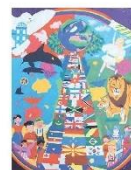
大谷 陽輝 高松県立