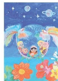
右 羽花 遠征しC