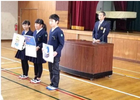
橘小学校にて表彰式