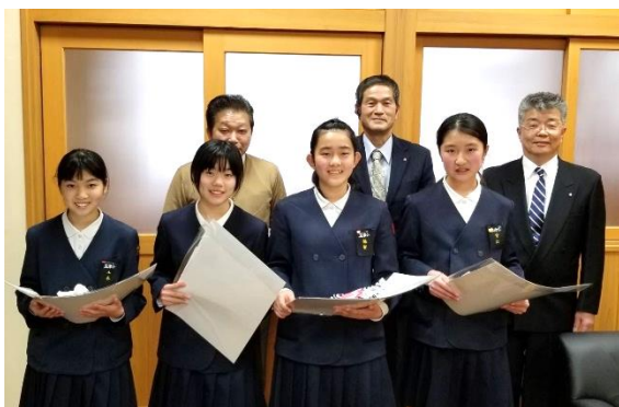
玉津小学校にて表彰式