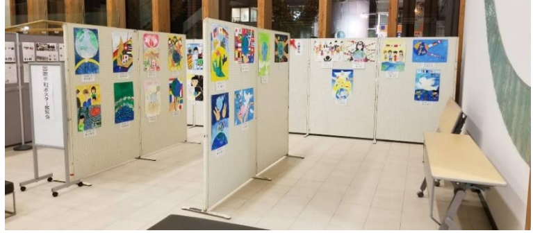
西条図書館にてポスター作品展示

作品の展示は、西条図書館に於いて12月7日(土)～12月22日(日)の約2週間行いました。《市報への掲載(作品展示情報)に時間を要し、展示が12月年末となりました、応募者への記念品(平和ポスター入りカレンダー)を渡すのが年明けとなったことに反省しております。》