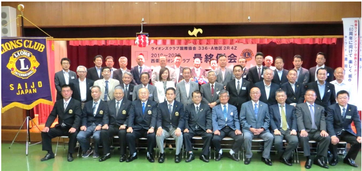
60周年へ向けて第59期を笑顔でバトンタッチ