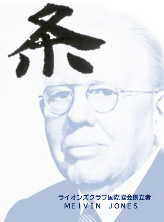
ライオンズクラブ国際協会創立者 MELVIN JONES