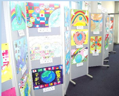
国際平和ポスター コンテスト応募作品展覧会

人の為に、社会の為に、一人ではできないことを、出会いを通して集まった会員が力を合わせて、それぞれの地域において社会奉仕に貢献していこうという団体です。