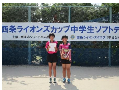
女子の部優勝 ペア