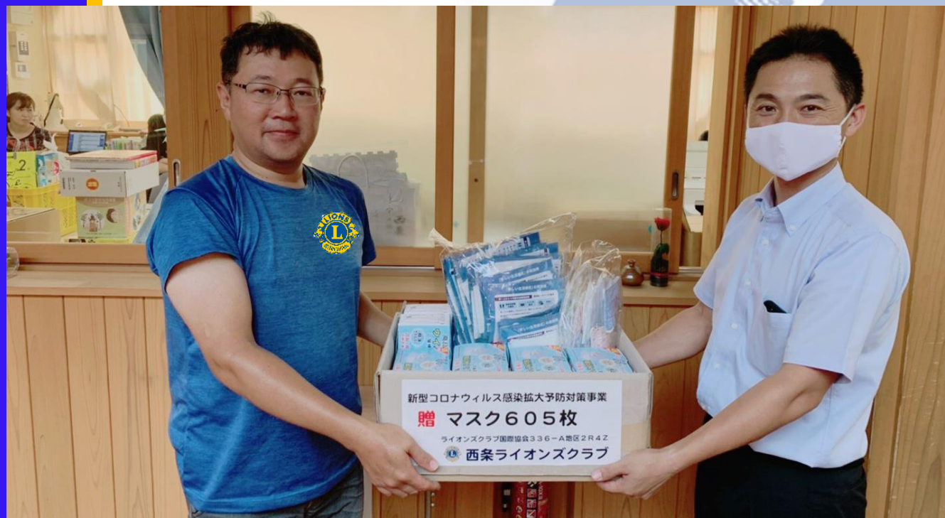
新型コロナウイルス感染予防対策事業 玉津小学校へマスク寄贈