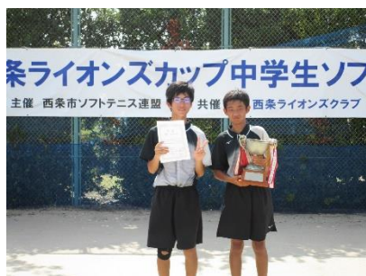
男子の部優勝 ペア

例年は開会式に参加しておりましたが、今年に限っては密を避けるため、ご遠慮いただきたいとの申し出があり協賛のみとなりました。