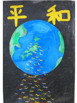
特別賞 曾我部裕斗 (玉津小5年)