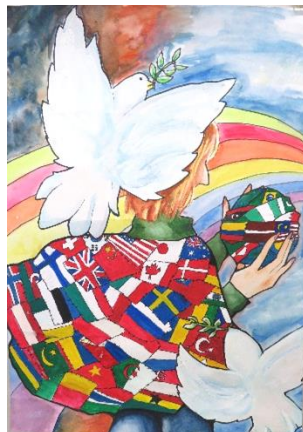
最優秀賞 黒川藍子 (玉津小6年)