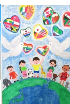
特別賞 馬場菜々花 (神拝小6年)