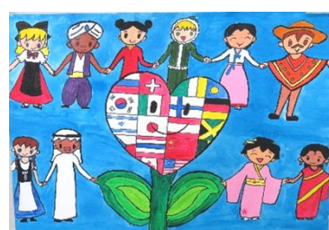
優秀賞 石川奏依 (神拝小6年)