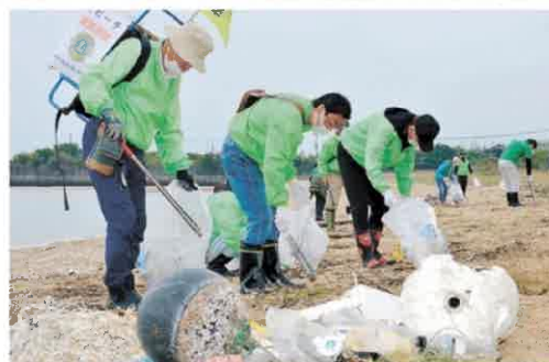
河原津海岸のごみを拾うライオンズクラブのメンバー