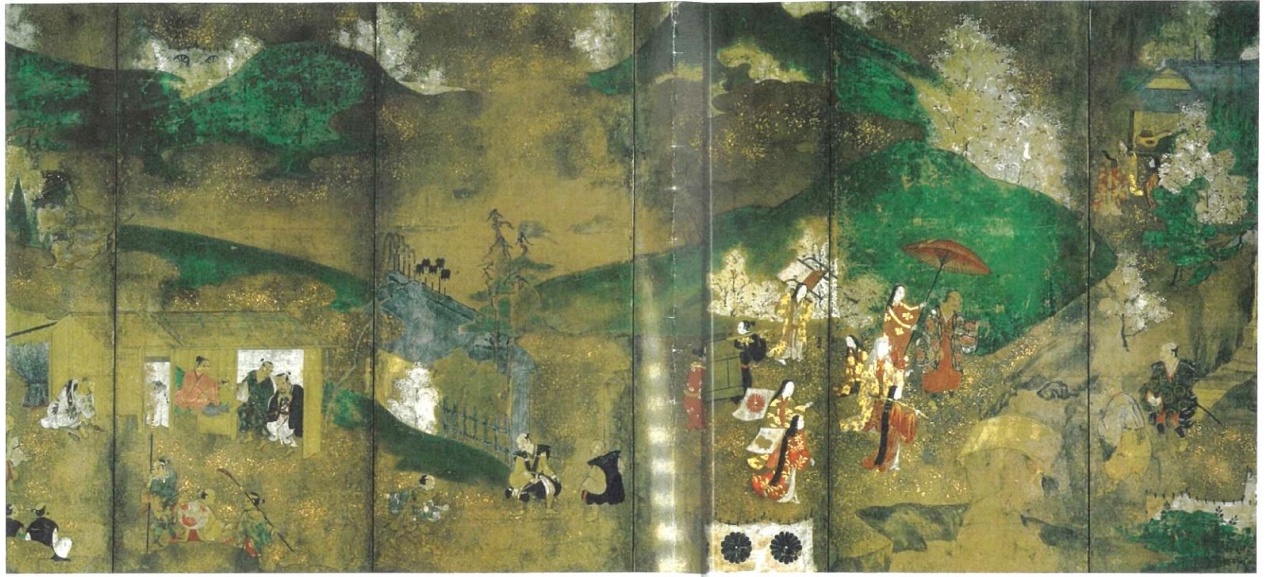
豊臣秀吉が北政所や淀君、配下の武将ら 1,300 余人を招いた「醍醐の花見」の様子 「醍醐花見図屏風」国立歴史民俗博物館蔵