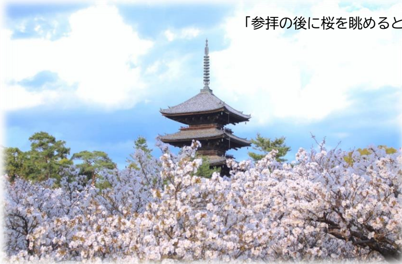
「参拝の後に桜を眺めると、巡るいのちの尊さに気づかされます」