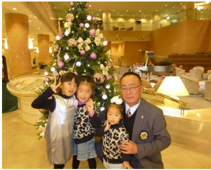
家族会にはご家族で参加されていました。