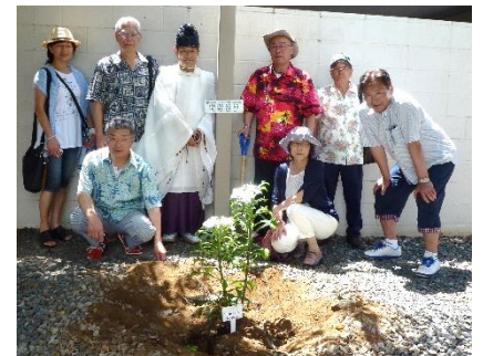
第98回ハワイ国際大会にはクラブから大勢で参加しました。姉妹提携クラブのアラモアナLCとも親睦を深め、 ハワイ石鐘神社には、記念植樹をしました。プルメリアの樹も大きく成長していることでしょう。