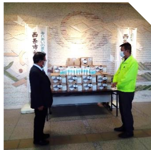
除菌ハンドジェル2000本 社会福祉協議会へ寄贈