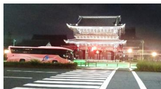
写真は今年 6 月の京都タワーと西本願寺正門の夜景です。